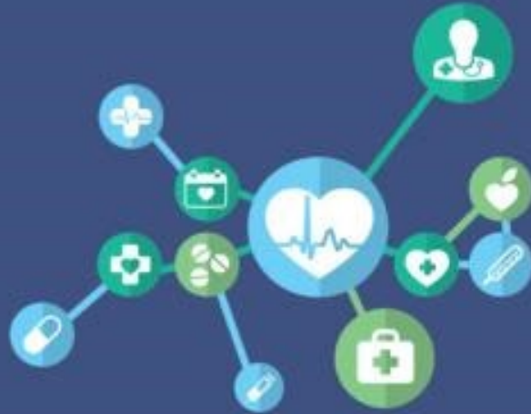
National Heart Failure Dashboard