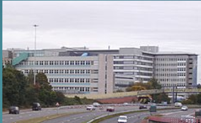
Ysbyty Athrofaol Cymru

Llawdriniaeth endocrin Llawfeddygaeth Gyffredinol ENT Gynaecoleg Llawfeddygaeth Niwro Aml-drawma Offthalmoleg Ceg/Genol Wyneb/Deintyddol Llawfeddygaeth Arennol Llawfeddygaeth Wroleg â Chymorth Robot Llawfeddygaeth Rywiol ac Atgenhedlol Llawdriniaeth trawsblannu Trawma ac Orthopaedeg Wroleg Fasgwlaidd