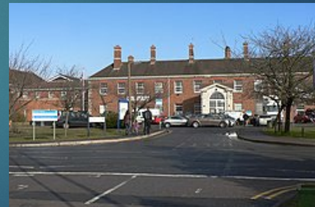
Ysbyty Athrofaol Llandochoau