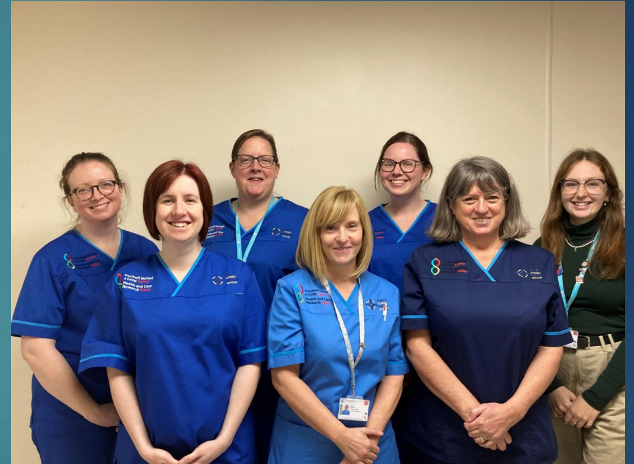
Tîm ymchwil llawfeddygol