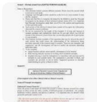
Y Yumpu | Informed Consent Form Te...