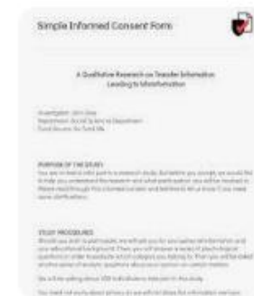
J Jotform | Simple Informed Consent...