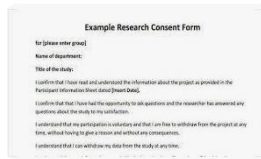
SF SampleForms.com | FREE 8+ Research Consent Forms in PDF ...