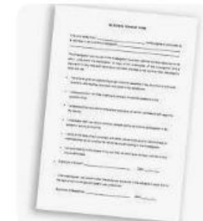
T Topend Sports | Informed Consent Form f...