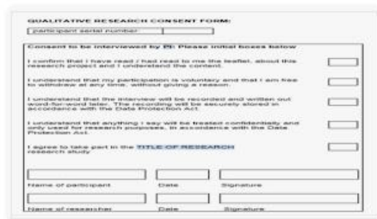
SF SampleForms.com | FREE 6+ Research Consent Forms in PDF ...