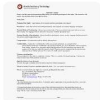
Studylib | Consent Form Template