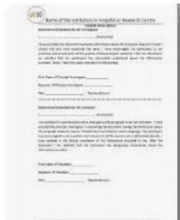
R ResearchGate | D: Consent form in Helsi...