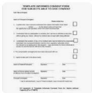
ST Sample Templates | Sample Research Consent F...