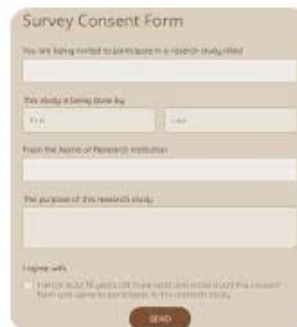
123 123FormBuilder | Consent Form Templates - ...