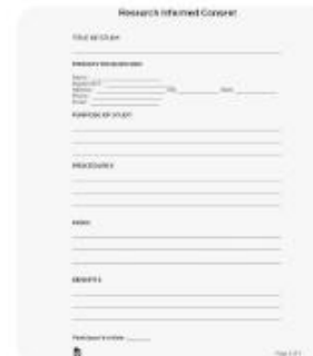
e eForms | Free Research Informed C...