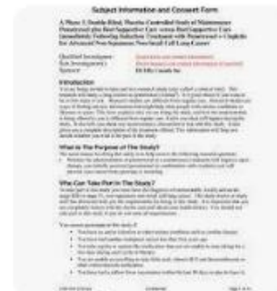
W Wikipedia | Informed consent - Wikiped...