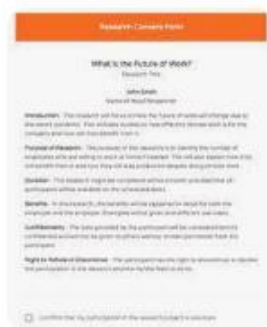
J Jotform | Research Consent Form...