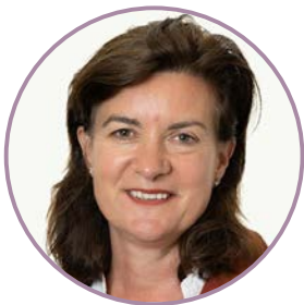
Eluned Morgan AS Gweinidog Iechyd a Gwasanaethau Cymdeithasol, Llywodraeth Cymru

Roedd hi'n bleser mawr iawn gennyf gymeradwyo cynllun Ymchwil Iechyd a Gofal Cymru ar gyfer 2022-2025 yn gynharach eleni, sy'n manylu ar agenda glir a heriol ar gyfer gwella ymchwil iechyd a gofal, ac sy'n sicrhau bod Cymru'n chwarae rhan lawn yn yr agenda ymchwil ledled y DU ac yn rhyngwladol.