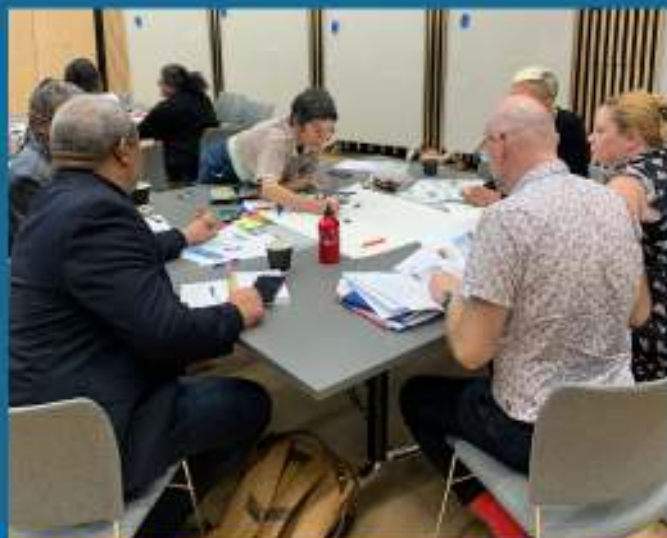
Gweithdy Technoleg Gynorthwyol Arloesol ar gyfer Dementia yn sbarcispark, Prifysgol Caerdydd

Daeth y prosiect hwn at ei gilydd mewn cyfarfod grŵp dementia CARE, lle nodwyd arbenigedd yn gyflym yn y maes. Fe wnaeth CARE ganiatáu i ni ymateb yn brydlon i alwad ariannu a llunio tîm amlddisgyblaethol. Mae wyth o bobl sydd wedi'u heffeithio gan